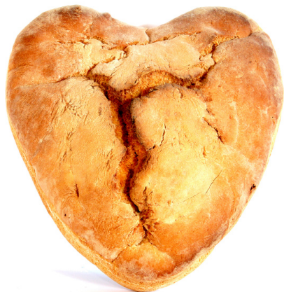
CUORE DI PANE